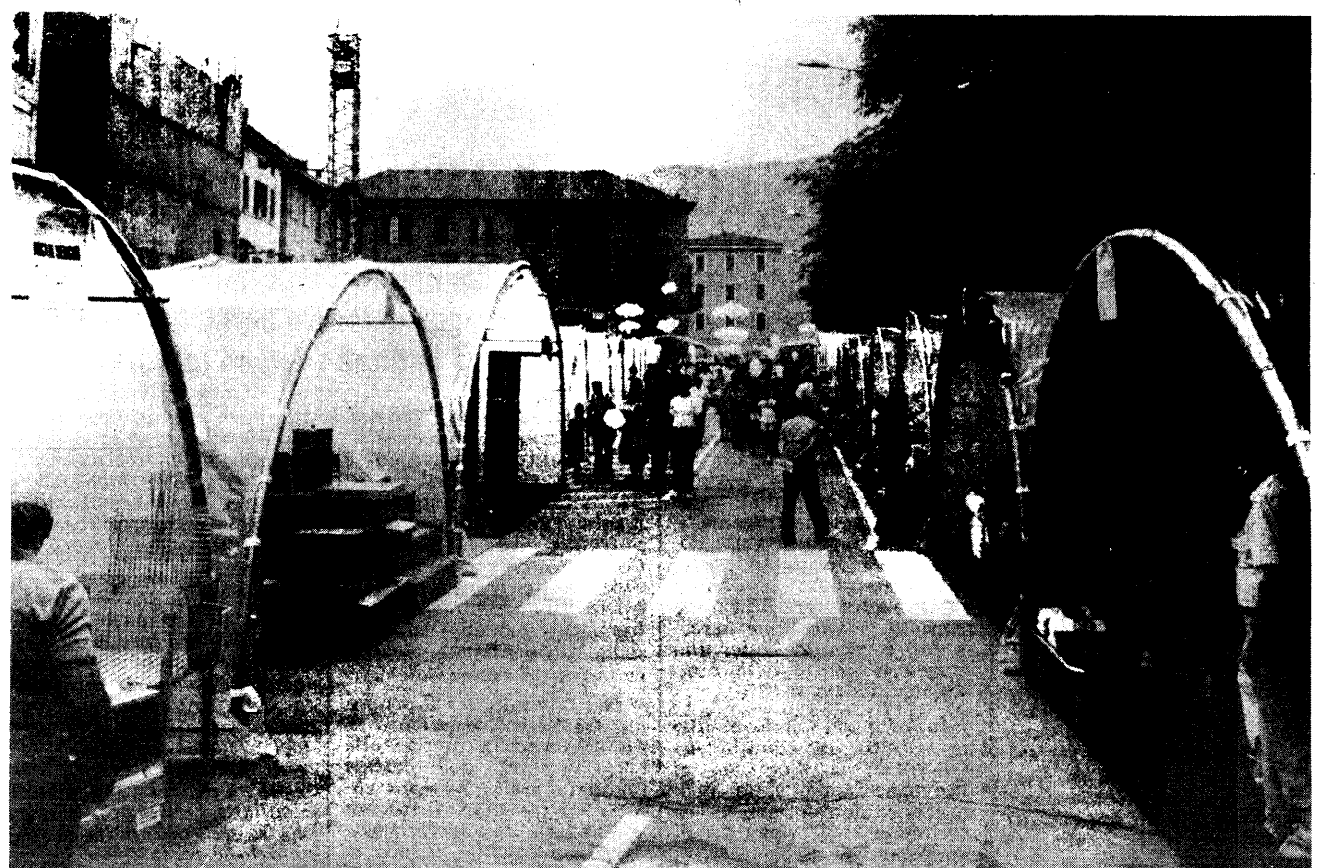
Ecco come la mostra-mercato si presentava l'anno scorso