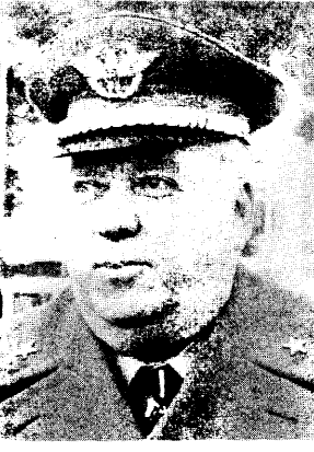
Il gen. Giuseppe Santovito

L'accusa è di «rivelazione di notizie coperte dal segreto di Stato» per aver passato a un settimanale un «dossier» sul terrorismo - Dopo una visita medica il giudice ha concesso all'alto ufficiale, malato di cirrosi epatica, di ritornare a casa