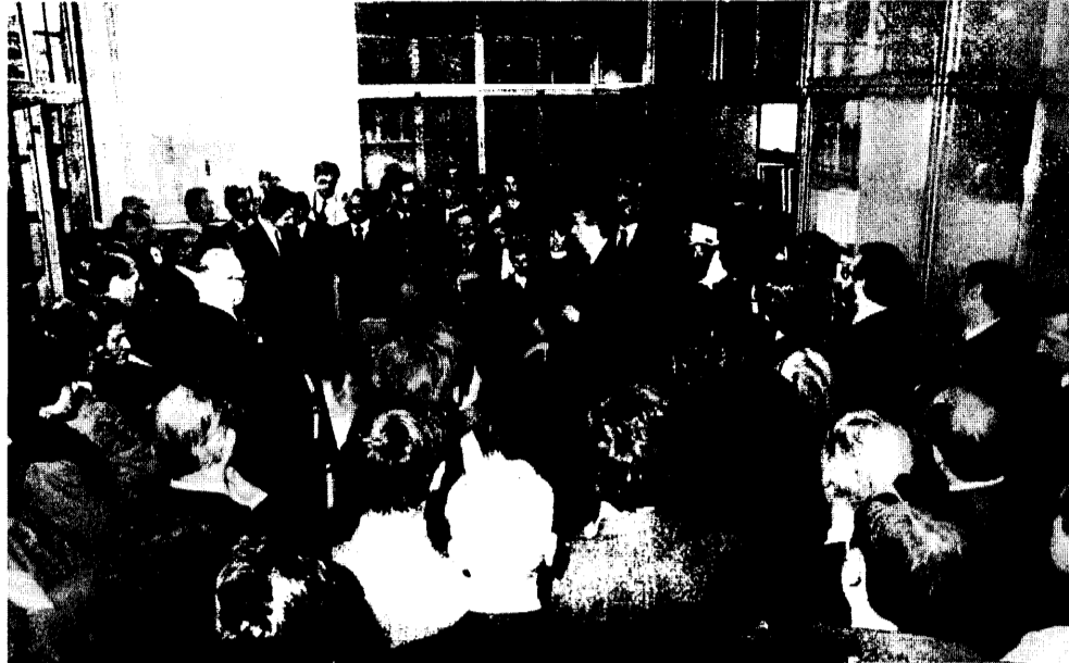
Un momento della cerimonia al Palazzo di Giustizia per l'intitolazione della biblioteca del Tribunale al giudice Guido Galli assassinato dai terroristi.

Nel piccolo cimitero di Piazzolo — come un monito — c'è una tomba che ricorda a tutti, da un paesino dell'Alta Valle Brembana, quanto ingiusta e aberrante sia la violenza. È il sepolcro del giudice Guido Galli, ucciso a 48 anni il 19 marzo 1980 a Milano mentre usciva dalla Statale da un «commando» di terroristi di Prima linea. A dimostrazione che il ricordo di lui sarà imperituro, Bergamo, la sua città, gli ha intitolato nel secondo anniversario dell'assassinio un'aula del suo Tribunale, in quello stesso Palazzo di Giustizia dove forse un giorno il magistrato sarebbe venuto a presiedere una delle sezioni penali.