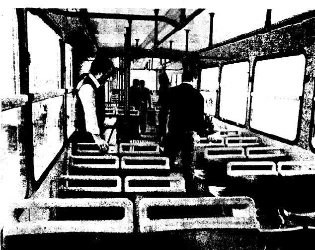
A sinistra il nuovo modello di autobus per trasporto suburbano, costruito dalla «Mauri & C.» di Desio, presentato ieri ai dirigenti della Tbsò. A destra, l'interno del nuovo modello di autobus snodato. I posti a sedere sono 58, mentre un altro centinaio di passeggeri possono trovare posto in piedi. Un'adeguata coibentazione ha consentito di ridurre la rumorosità.