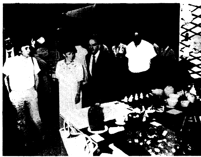
L'assessore regionale dott. Giovanni Ruffini mentre visita la mostra mercato di Sarnico.

alle più sofisticate tende da sole, dagli oggetti in pelle lavorati a mano alle canoe, ed ancora il miele con i suoi vari estratti, il buon vino della Valle Calepio, e tanti altri prodotti e progetti che riteniamo siano interessanti per tutti. La novità assoluta di questa edizione è però la mostra del «9x9», reclamizzata concretamente attraverso una serie di pannelli e di realizzazioni che vogliono indirizzare l'artigiano verso una forma di collaborazione fra produzione e progettista. Si tratta di nove giovani che propongono la propria esperienza maturata in un progetto che ha buone probabilità di vedere uno sviluppo concreto anche in un prossimo futuro. Maria Teresa Azzola così riassume la sua esperienza: «Si è articolata in varie fasi: per alcuni artigiani e progettisti questa è stata la prima esperienza concreta