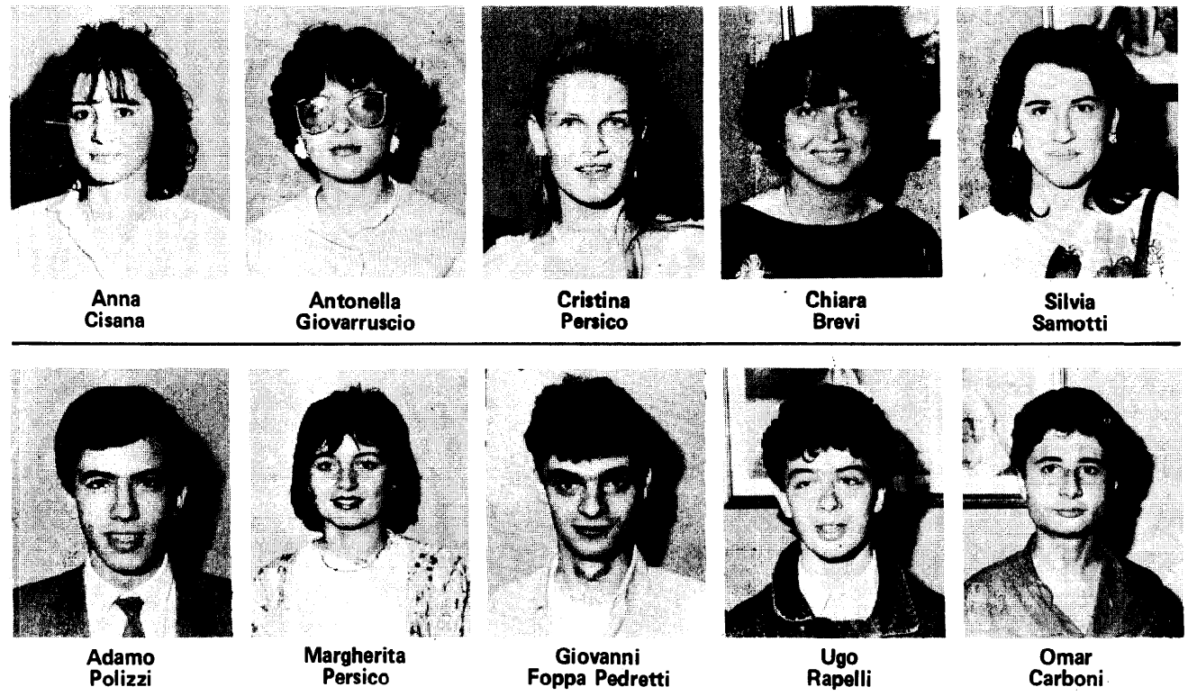
«Non limitatevi alla frequenza ai corsi ma fate forza della vostra formazione»

Lo ha detto l'assessore regionale Ruffini alla «festa del parrucchiere» della Associazione Artigiani, riferendo di una recente indagine Il saluto ai giovani dell'onorevole Citaristi e delle altre autorità