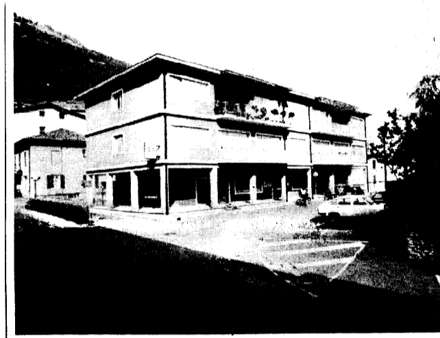
La palazzina che ospita il Municipio, la farmacia e l'ambulatorio comunale.

nare alla realizzazione di impianti sportivi; si vogliono anche mettere a disposizione dei giovani alcuni locali nel complesso di Palazzo Silvestri, da adibirsi a sede di attività varie; l'amministrazione si è anche impegnata ad affrontare il problema della droga, che purtroppo si sta diffondendo in misura notevole anche qui. Il problema dell'occupazione è per certi versi strettamente legato al primo, poiché esso interessa spesso in misura maggiore i giovani alla ricerca del primo lavoro. La nostra zona non offre oggi molte possibilità, ma l'amministrazione ha appena predisposto un piano, che dovrebbe favorire il riassorbimento dell'attuale domanda. Si tratta del piano per gli investimenti produttivi, che si avvia ora alla fase esecutiva. Nel campo dei servizi sociali la commissione scuola