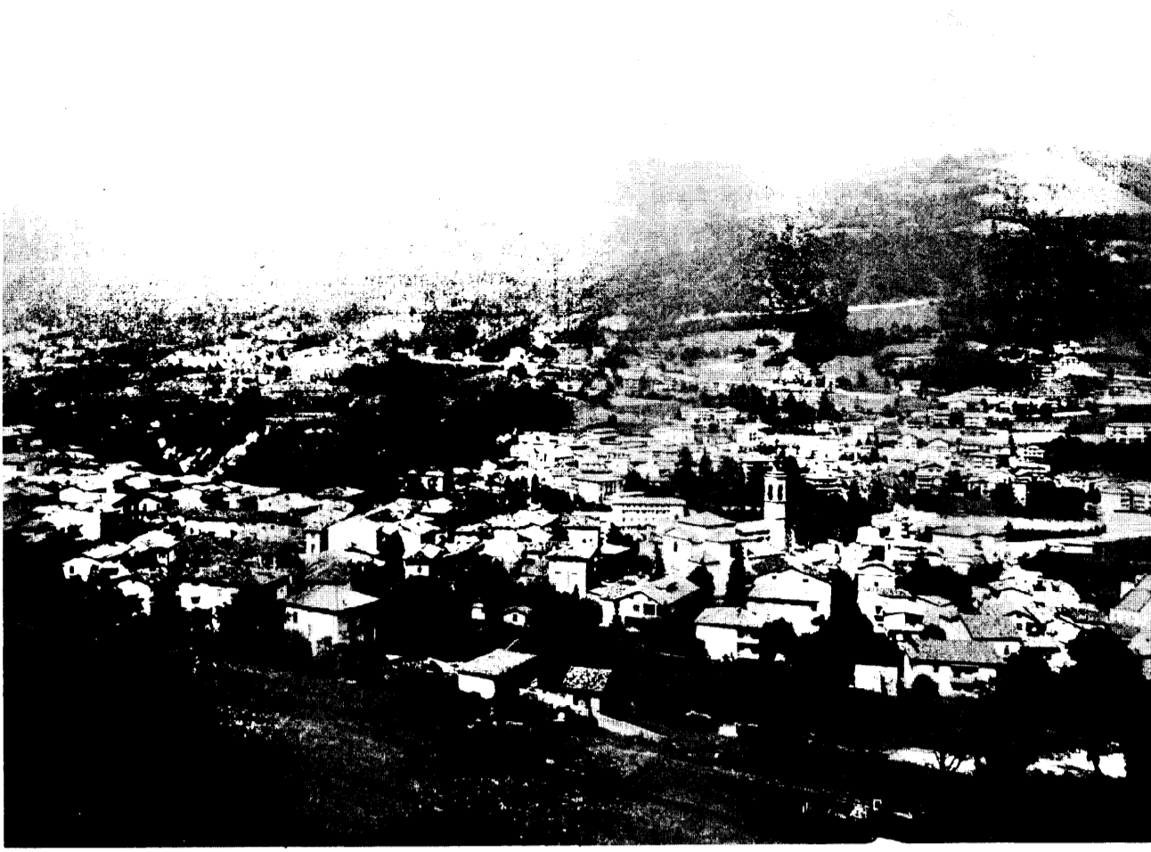
Uno scorcio del paese: in primo piano borgo S. Martino. Sullo sfondo a sinistra si intravede la frazione Piazza.

Con il varo del piano regolatore generale avviate nel 1980 iniziative per un adeguato uso del territorio - Realizzate numerose opere pubbliche - Potenziato l'acquedotto - La rete per il metano - Gli interventi per il Borlezza