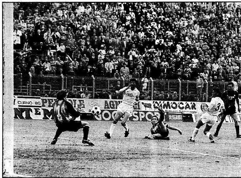
Palla-gol per Fortunato: ribatte Martina