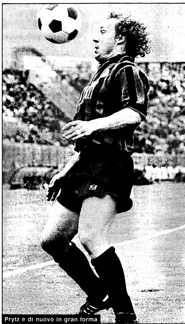
Prytz è di nuovo in gran forma

Vi riveliamo alcune curiosità «dietro le quinte» della politica