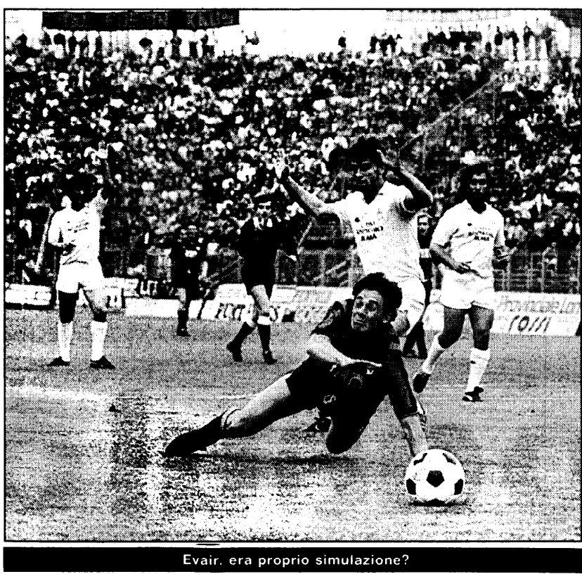
Evair, era proprio simulazione?

In tribuna d'onore tre parlamentari bergamaschi, persone che «vivono» quasi stabilmente a Roma e quindi possono riferire sulla situazione sportiva che vede la squadra bergamasca avvantaggiata in classifica nei confronti delle due formazioni capitoline.