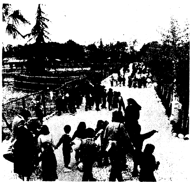
Una panoramica del Parco-zoo di Valbrembo durante la visita di alcune scolaresche.

Questo percorso è senz'altro piatista. Per questioni di sicurezza (il recupero dell'auto) è molto più frequentato il seguente percorso: S. Lucia, Capanna Ilaria, m.