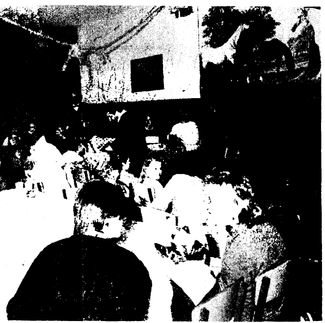
Un momento del trattamento offerto ai pazienti del Centro di ippoterapia di Torre Boldone.