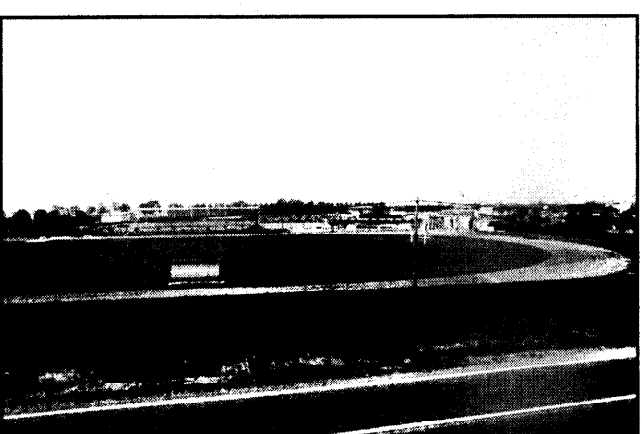
Un particolare del nuovo stadio comunale di Stezzano, con la tribuna sullo sfondo.