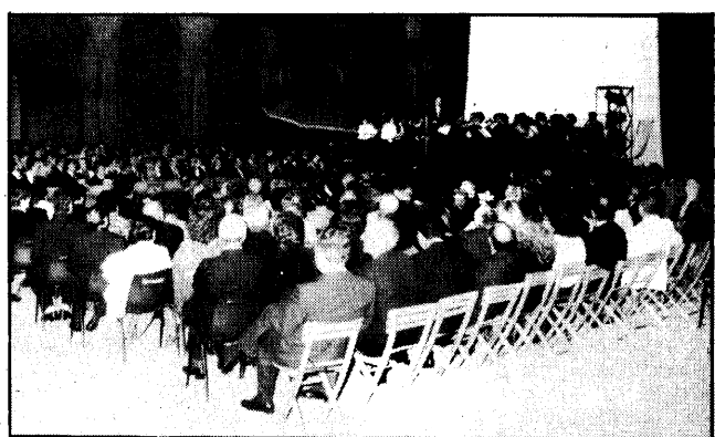
L'orchestra «Costantino Quaranta» suona nel cortile del Castello Visconteo di Brignano, nella festa dei Lions di tutta la provincia.

Brignano, 26. Intermeeting di tutto rilievo quello indetto al Castello visconteo di Brignano dal vicegovernatore del distretto 108 I-B VIII circoscrizione della International association of Lions Club, dr. Vittorio De Giorgio, a conclusione dell'annata lionistica.