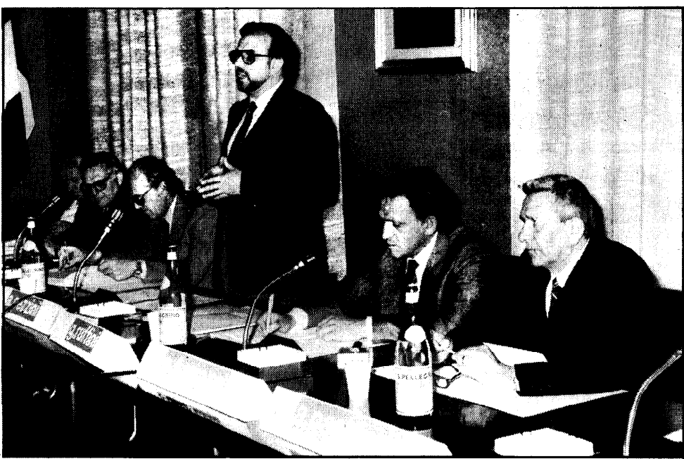
Un momento del convegno dell'Associazione Artigiani a Selvino.