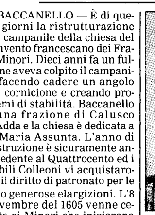
Il campanile della chiesa dei Fratelli Minori di Baccanello, recentemente ristrutturato.