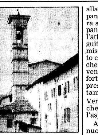
Il campanile della chiesa dei Fratelli Minori di Baccanello, recentemente ristrutturato.