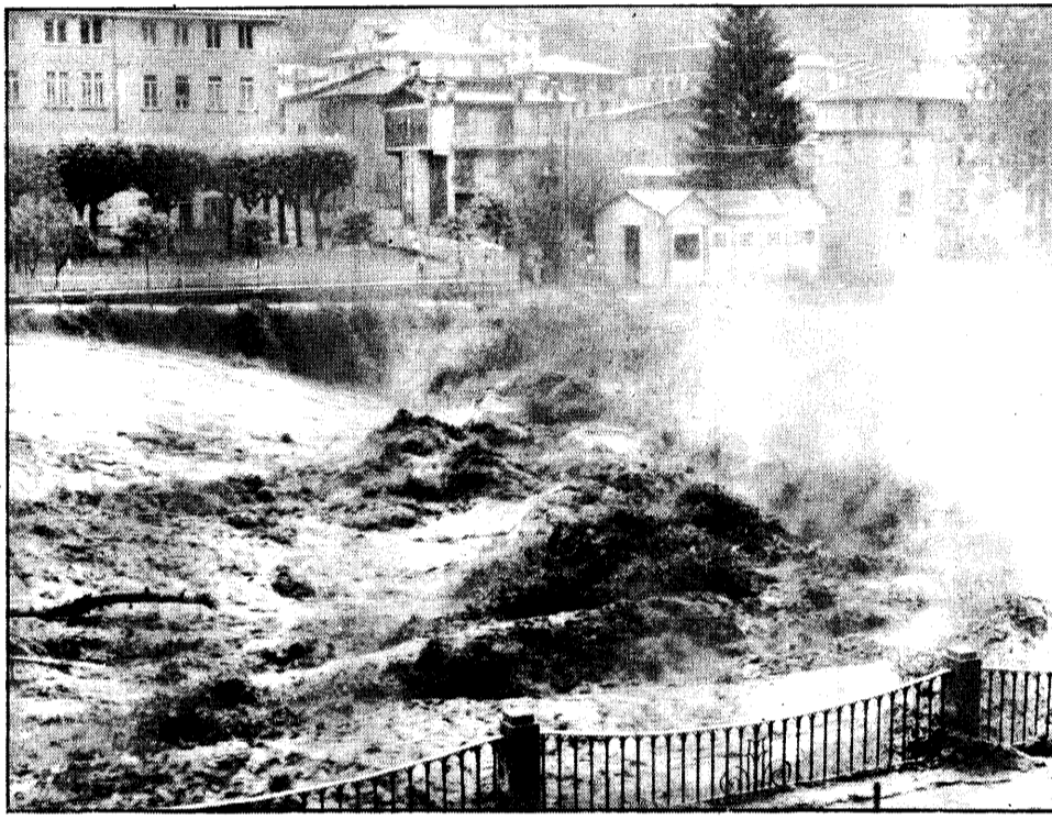
L'irruenza del Brembo nella zona della diga a San Pellegrino.

torio era veramente pauroso, le strade erano trasformate in torrenti e ricoperte di massi e fango; la parte bassa del paese — zona campo sportivo — era completamente allagata; pare siano state gravemente danneggiate alcune cascate ed altre addirittura spazzate via. Si dovrà comunque attendere la luce del giorno per fare un quadro completo della situazione. Il secondo disperso, pare una donna — ma è notizia non confermata — sarebbe stato travolto dalla corrente in zona Ponte delle Acque, dove sono state spazzate via anche alcune vetture. Già nel tardo pomeriggio squadre di soccorso si sono avviate verso Mezzoldo per tentare di raggiungere a piedi il paese.