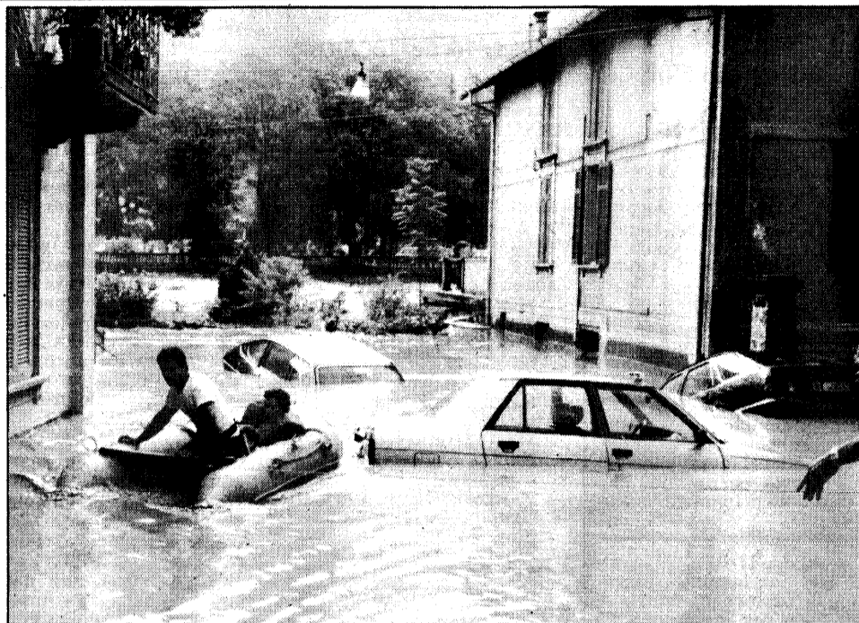
La via San Carlo a San Pellegrino ieri verso le 19,30: auto sommerse dall'acqua e gente in canotto.

L'epicentro del nubifragio e del disastro pare essere localizzabile sopra la Valle di Mezzoldo, più esattamente in località «Ponte delle Acque, che già nell'agosto del 1985 era stata interessata da un nubifragio che aveva spazzato via un chilometro di strada. Il Brembo ha letteralmente invaso il paese, dall'alto l'aspetto del terri-