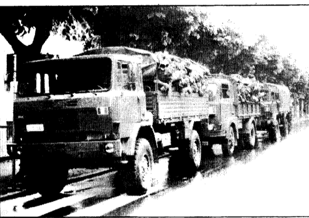
I militari del Battaglione Palermo della «Legnano» in attesa di intervenire nei soccorsi.

Un'ora dopo il primo segnale di allarme, lungo la strada statale della Valle Brembana, chiusa al traffico prima ai ponti di Sedrina e poi a Villa d'Alme, sono affluiti i veicoli dei soccorritori. Fra i primi ad arrivare abbiamo visto un reparto di militari del Battaglione meccanizzato «Palermo», alcuni automezzi della Protezione Civile di Alzano Lombardo il cui compito era quello di portare sacchi di sabbia a Piazza Brembana, i veicoli dei tecnici dell'Enel, della Snam, della Sip. I primi ad affrontare la situazione di emergenza sono stati comunque i carabinieri delle stazioni locali che hanno cercato, finché è stato possibile, di arginare i pericoli maggiori. Per seguire da vicino l'evoluzione della situazione, presso il comando di Zogno si è recato anche il ten. col. Santoro del Gruppo di Bergamo. Sulla valle hanno volteggiato di continuo gli elicotteri dell'Eliucleo Carabinieri di Orio al Serio.