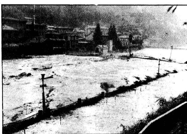
Un'auto trascinata nel Brembo; per fortuna non c'erano passeggeri.

paesi di Valleve e Poppolo. Per precauzione, fin dal primo pomeriggio, ingrossandosi il fiume, si è proceduto allo sgombero del Campeggio San Simone, che sta proprio ai bordi del Brembo. E corsa voce che una roulotte sarebbe stata spazzata