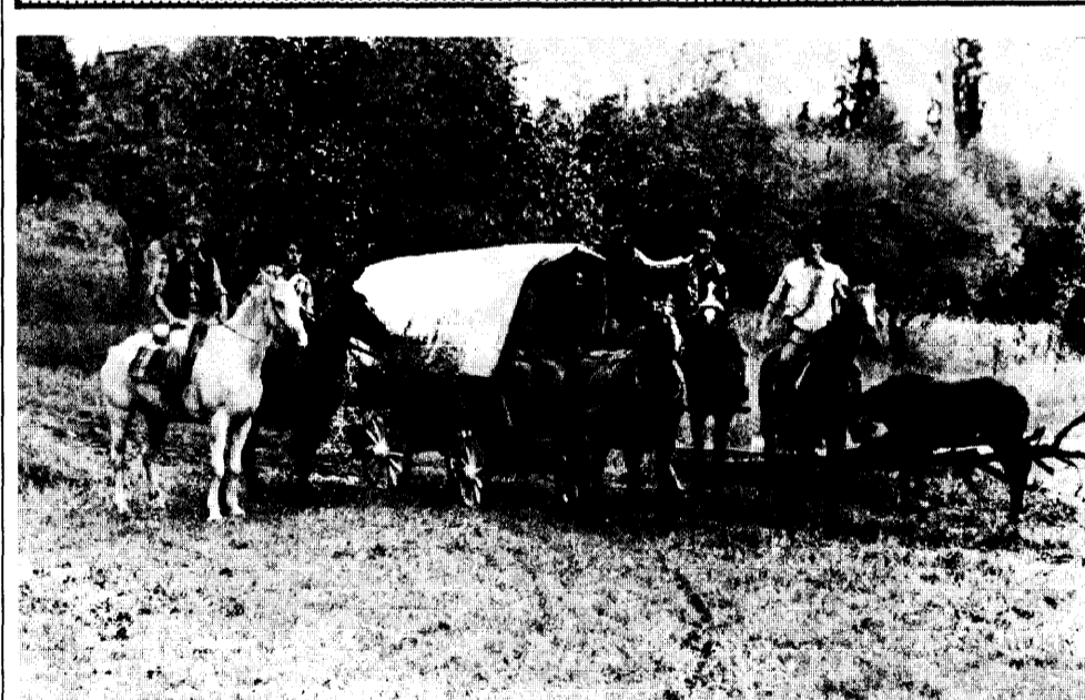
Villa d'Adda, 9