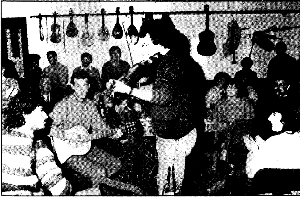
Il folk-singer Martin Jenkins durante la serata trascorsa con gli «Zanni».

I reiterati tentativi di riunire in una sola federazione, folk-clubs o le varie compagnie italiane operanti in materia di folk-music, cultura e tradizioni popolari, sino ad oggi erano andati falliti, vuoi per la scarsa capacità organizzativa dei promotori, vuoi per via delle notevoli difficoltà che il progetto presentava. Ora però sembra proprio che tanti sforzi abbiano sortito risultati positivi, tant'è che la federazione si farà. Si chiamerà «Folk-Italia» e i promotori hanno già stilato una sorta di «codice» di appartenenza che prevede clausole ben precise, come la indipendenza politica e confessionale dei vari affiliati o il fatto che questa specie di associazione di folk-clubs o altre realtà operanti nel settore, non dovrà avere scopi di lucro, ma agire nell'esclusivo interesse della musica folk, col preciso scopo di diffonderla, studiarla, promuoverla e ricercarla.