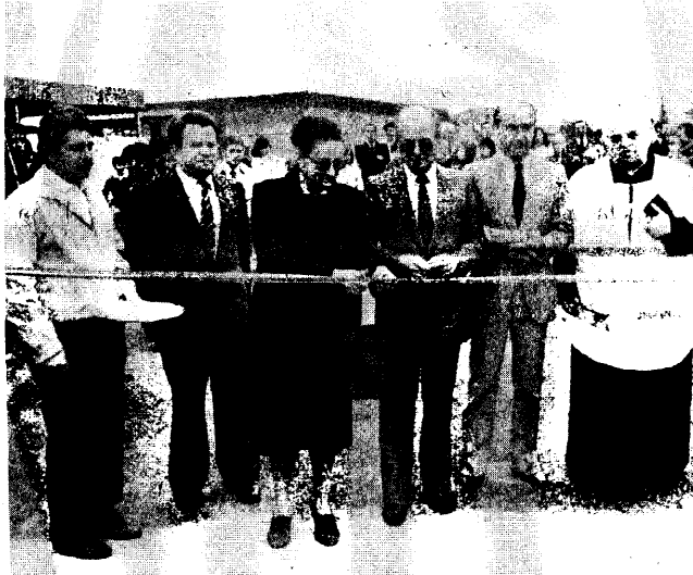
Il momento del taglio del nastro per il nuovo complesso degli impianti sportivi a Stezzano. L'inaugurazione è avvenuta ieri pomeriggio.

Stezzano, 21. L'inaugurazione dei nuovi impianti sportivi di Stezzano ha avuto il significato di grande festa popolare e di sport, per tutta la popolazione, in particolare per i giovani e i ragazzi. La cerimonia avvenuta alle 14, è stata abbinata alla fase provinciale dei Giochi della Gioventù, le nuove strutture hanno ospitato per la prima volta gare di atletica per circa 800 alunni delle scuole medie di venti paesi facenti parte del distretto scolastico n. 29.