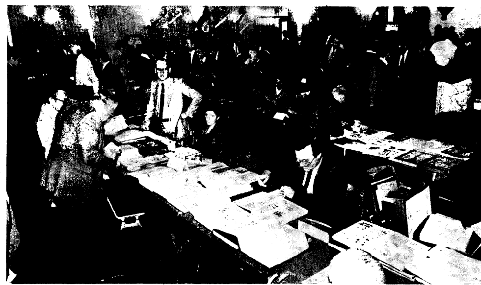
Una veduta del salone del convegno commerciale che si conclude stasera. Durante la giornata l'affluenza è stata notevole.

Si è aperto ieri mattina il XXVII Convegno filatelico bergamasco per tutta la giornata, seppure tormentata dalla pioggia, l'affluenza di pubblico è stata buona. La recente crisi che ha colpito vari settori dell'economia italiana ha in parte toccato anche la filatelia, ma la passione e la buona tenuta dei francobolli di prestigio hanno permesso che i convegni non morissero.