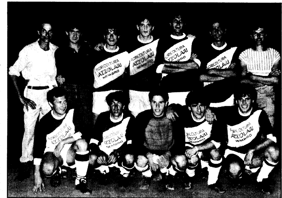
La squadra "Azzolari fioricoltura Nembro" vincitrice del torneo di calcio notturno a Leffe.

Si è concluso nei giorni scorsi a Leffe la centesima edizione del torneo di calcio notturno "Angelo Castelletti" per squadre a sette giocatori. Vi hanno preso parte 16 compagini nella categoria "liberi" e in quella riservata ai "ragazzi". Il torneo, che è iniziato il 3 giugno, ha visto una fortissima partecipazione di