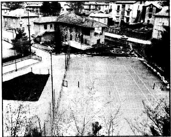
Il campo di tennis di Erve realizzato dal Comune.

Domani, domenica 21 luglio, la Pro-Erve apre ufficialmente il ciclo delle manifestazioni estive per la villeggiatura 1985 con la "2.a Sagra del dolce".