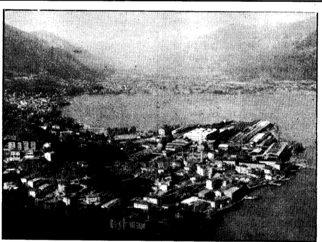
Il panorama di Castro e il lago.

Avvenire) si è già a buon punto, con l'allestimento dei mezzi interni. «Proprio qui davanti - prosegue il primo cittadino - intendiamo creare un'area di parcheggio in funzione di una prossima, per ora ancora ipotetica, destinazione di questa zona a "fulcro", a centro sociale del paese».