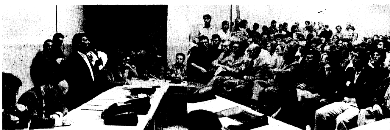
Una fase dell'assemblea aperta svoltasi ieri mattina nello stabilimento Cantoni di Ponte Noss.