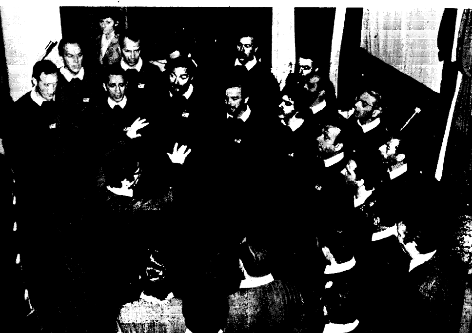
Un momento di una esecuzione del Coro ICAT di Treviglio, i cui successi vanno infittendosi a livello nazionale. Il Coro, di ventotto-trenta componenti, è diretto dal Maestro Bittonte ed entra nel quinto anno di attività.

Treviglio, 24. I successi del Coro I.C.A.T. di Treviglio ormai non si contano più: di domenica in domenica giungono sempre nuove notizie che raccontano di successi del Coro, strappati a platea piena, con il consenso della stragrande generalità del pubblico e degli esperti delle Giurie. A buon diritto, il Coro ICAT si colloca oggi fra i maggiori Cori nazionali: anzi, qualcuno lo definisce uno dei migliori in senso assoluto, grazie ad un'armonizzazione e ad una capacità vocale quali raramente si riscontrano in altri Cori, anche fra quelli che vanno per la maggiore.