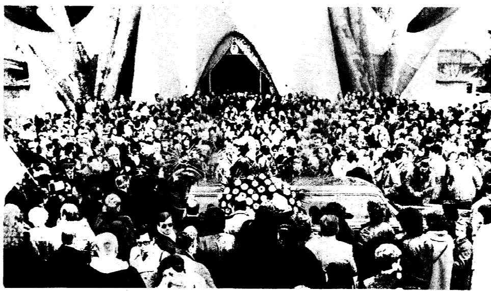
Un momento del funerale dell'on. Vittoria Quarenghi. Dopo la S. Messa celebrata nella chiesa parrocchiale di Longuelo il feretro sta per essere trasportato a Prezzate, paese natale della parlamentare scomparsa.

Il lavoro in parrocchia, nell'Azione Cattolica, nel Consiglio Pastorale diocesano, nel partito e in Parlamento erano per Vittoria Quarenghi modi d'essere dello stesso servizio, tanto che, eletta alla Camera, riteneva che il proprio tempo ormai appartenesse a coloro che l'avevano delegata a