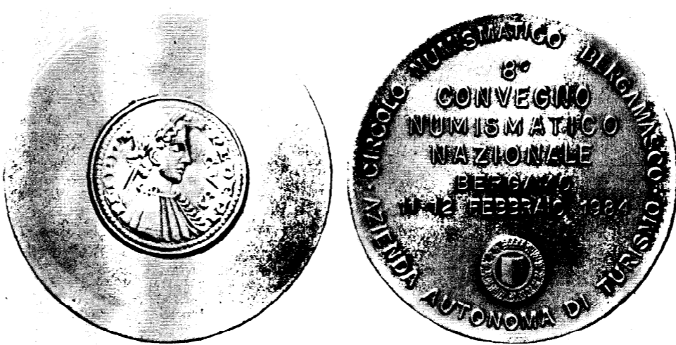
Il diritto e il retro della medaglia coniate dal Circolo Numismatico per il convegno nazionale di sabato e domenica. La medaglia rappresenta il «grosso», la più nota moneta coniatata dalla zecca di Bergamo.

Appuntamento sabato e domenica con l'8.º convegno numismatico nazionale. Lo organizza, come di consueto, il Circolo numismatico bergamasco col patrocinio dell'Azienda autonoma di turismo. Un appuntamento che rientra nelle manifestazioni tradizionali che si tengono in città e che è sempre molto atteso, sia dai numismatici veri e propri, sia da coloro che sono interessati a quei frammenti di storia, d'arte e di cultura che ogni moneta e medaglia racchiude.