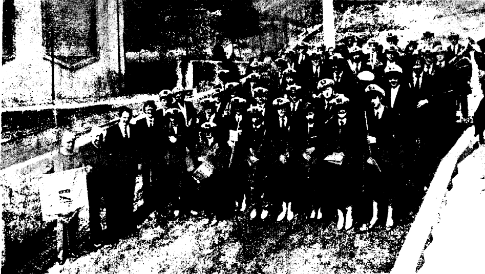
Il Corpo Musicale di Costa Volpino

Il complesso, fondato nel 1925, ha avuto un notevole rilancio e conta attualmente quarantasei componenti