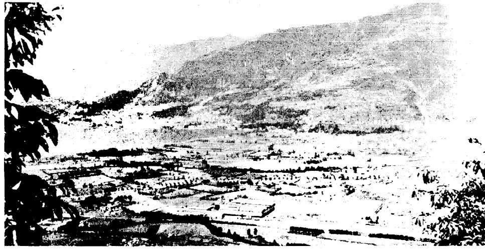
Una veduta panoramica di Costa Volpino.

Questo pomeriggio alle ore 17 l'assessore regionale all'Industria ed all'Artigianato, dott. Giovanni Ruffini, presiederà la cerimonia di inaugurazione della seconda edizione della «Fiera del Lago» (prima Mostra Campionaria), che, organizzata dalla Pro Loco di Costa Volpino, con il patrocinio della Regione Lombardia, è stata allestita sulla Sponda Nord del Lago d'Iseo, in località «Bersaglio».