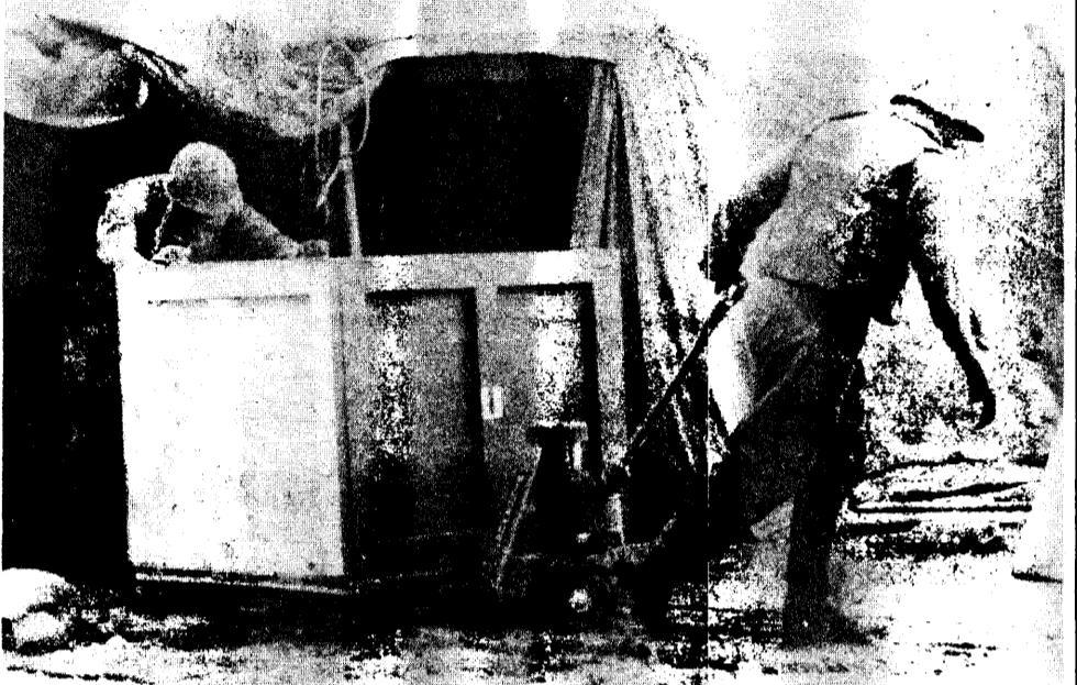
Due marines della forza di pace preparano i cassoni con i quali saranno portati via a ritmo accelerato tutti gli equipaggiamenti che sono serviti al contingente durante la permanenza a Beirut, nella base vicino all'aeroporto internazionale.

CITTA' DEL VATICANO, 8. Giovanni Paolo II si è rivolto a Reagan, con un messaggio personale, perché favorisca un'«immediata tregua» in Libano. L'ha rivelato il Papa stesso rivolgendosi a ottomila persone, presenti nell'aula «Paolo Sesto» per l'udienza generale. Dopo aver affermato di seguire in questi giorni «momento per momento», con particolare attenzione lo svolgersi degli avvenimenti «in Libano», il Papa ha proferito: «Profondamente turbato da tanta sofferenza delle popolazioni libanesi e preoccupato per la stessa sopravvivenza del loro Paese, ieri