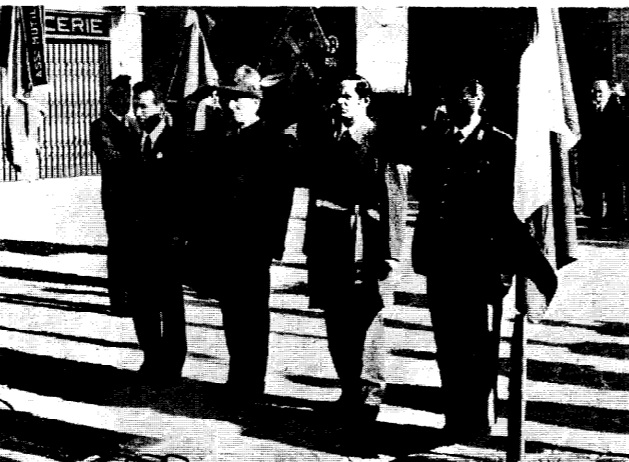
Il saluto delle autorità al Monumento ai Caduti di Villa d'Almè.

Un'analoga cerimonia si svolgeva nel frattempo presso il monumento ai Caduti di Pontecorona, presenti, in ambedue i casi, le rappresentanze combattentistiche e d'arma, assessori e consiglieri comunali e con la prestazione del Corpo bandistico di Pontecorona.