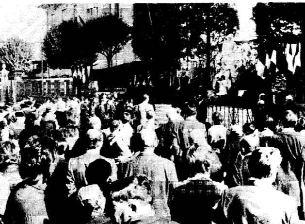
La cerimonia patriottica a Cene.