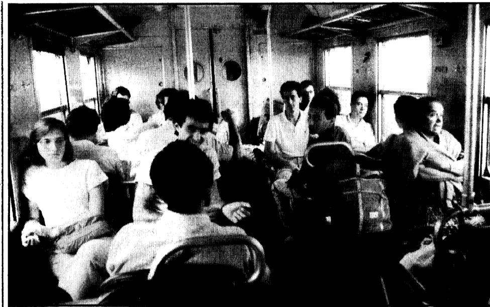
I collegamenti ferroviari con Milano sono sempre disagiati e tra i pendolari serpeggia il malumore.